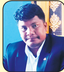
बुद्धिमान दनुवार प्रमुख प्रशासकीय अधिकृत