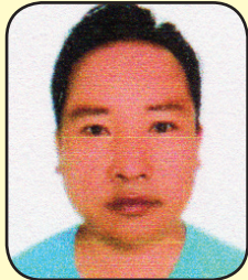
किस्मत राई वडा नं. ११ वडा अध्यक्ष