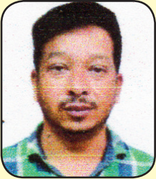
प्रकाशमान श्रेष्ठ वडा नं. ६ वडा अध्यक्ष